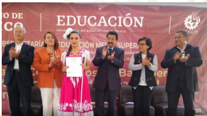
Ceremonia de entrega de certificados de bachillerato para estudiantes con discapacidad.